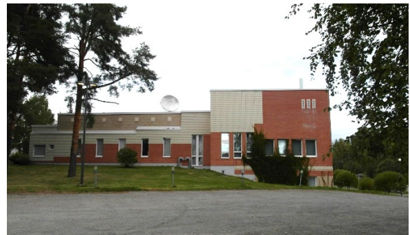
Kampuksen portti ja päärakennus tulosuunnasta nähtynä.