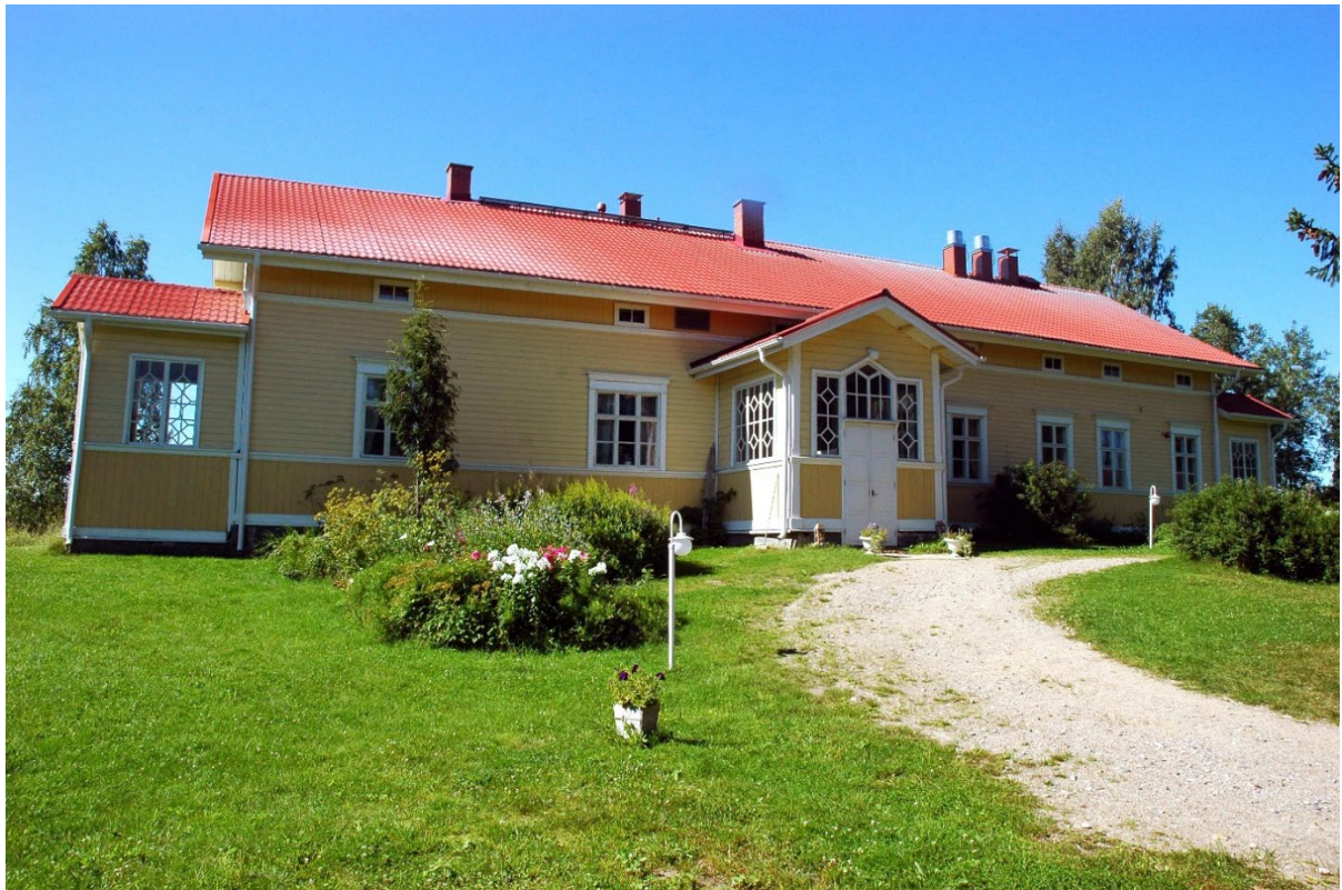
Uuraisten Marjoniemen vanha kirkkoherranpappila, ennallistettu 2006-2009.