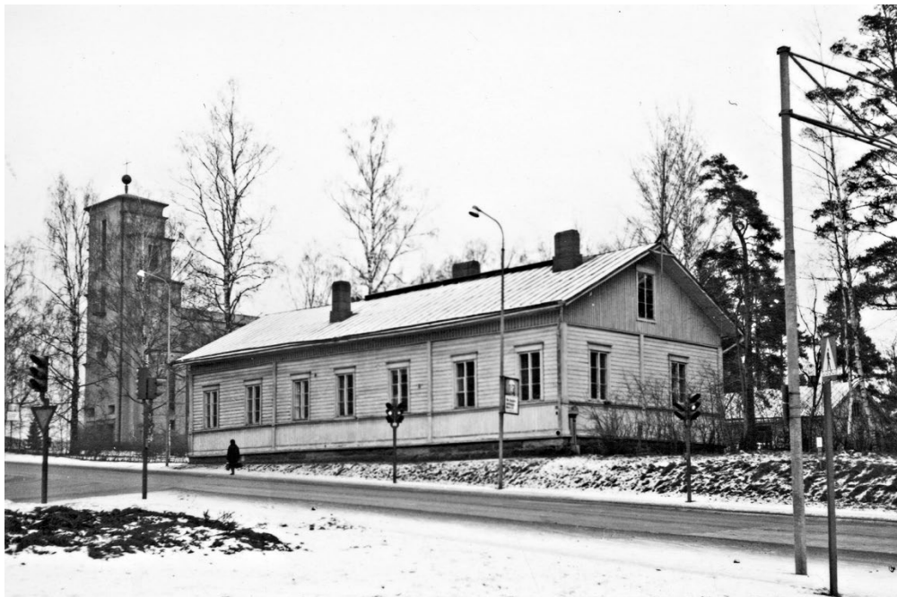
Puistokadun yläpäässä sijainnut pitäjäntupa-pappila