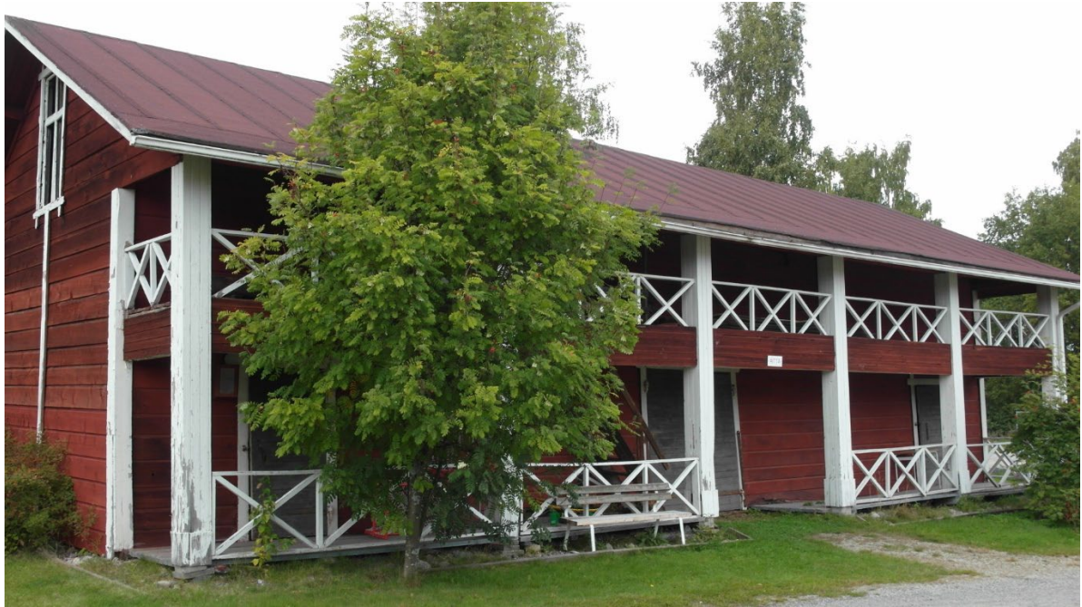
Kampuksen vanhaa ja uutta rakennuskantaa, luhtiaitta ja Patruuna, toinen majoitustiloista.