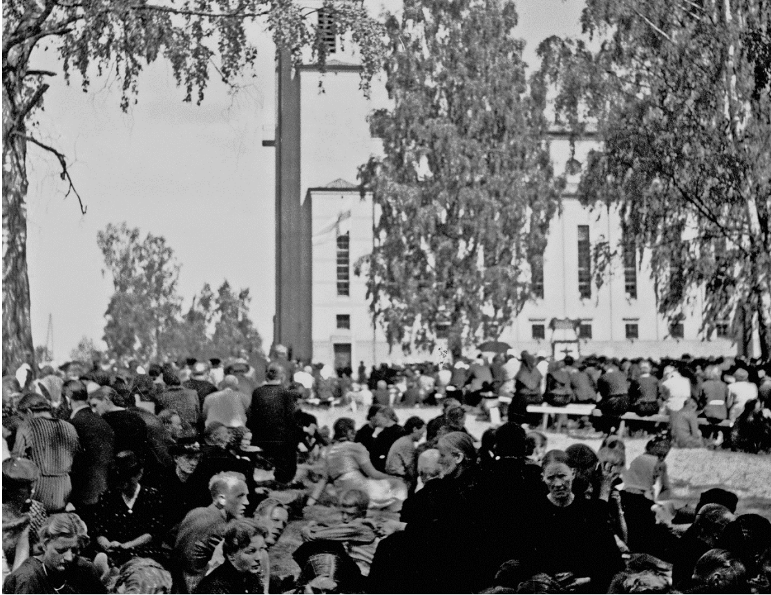
Jyväskylän Herättäjäjuhlien juhlakenttää ennen ja nyt.