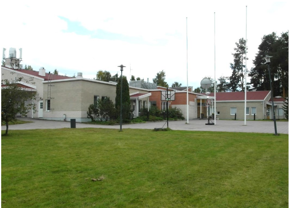
Opiston pää-, hallinto-, juhlasali- ja ravintolarakennus kampuksen sisäpihalta kuvattuna.

Meidän jokaisen kristityn on kysyttävä itseltämme: puuttuuko meiltä yksi, minulta, sinulta. Mikä se yksi on tänä päivänä?